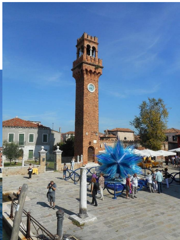
Ostrov sklářů - Murano