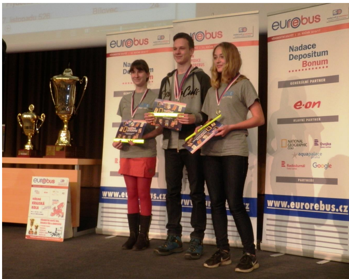
2.místo v kraji v kategorii SŠ - pro družstvo třídy 4.B