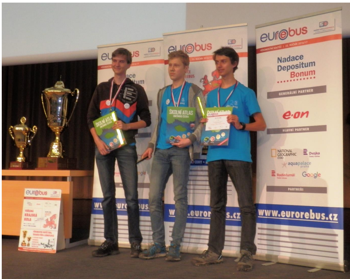
1. místo v kraji v kategorii SŠ - družstvo třídy 3.A