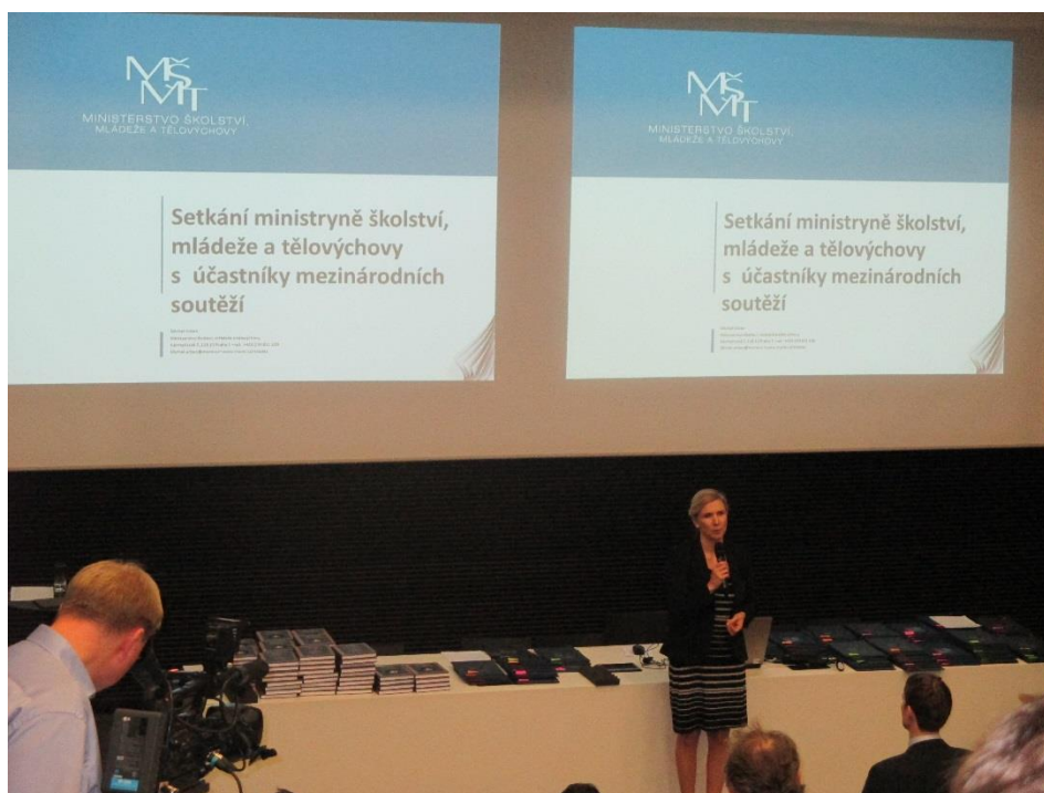
Ministryní školství, mládeže a tělovýchovy Mgr. Kateřina Valachová

Srdečně mu blahopřejeme a přejeme mu mnoho dalších studijních úspěchů.