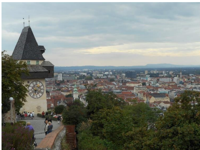
Graz s Hodinovou věží

Den druhý – Graz a Klagenfurt (Rakousko)