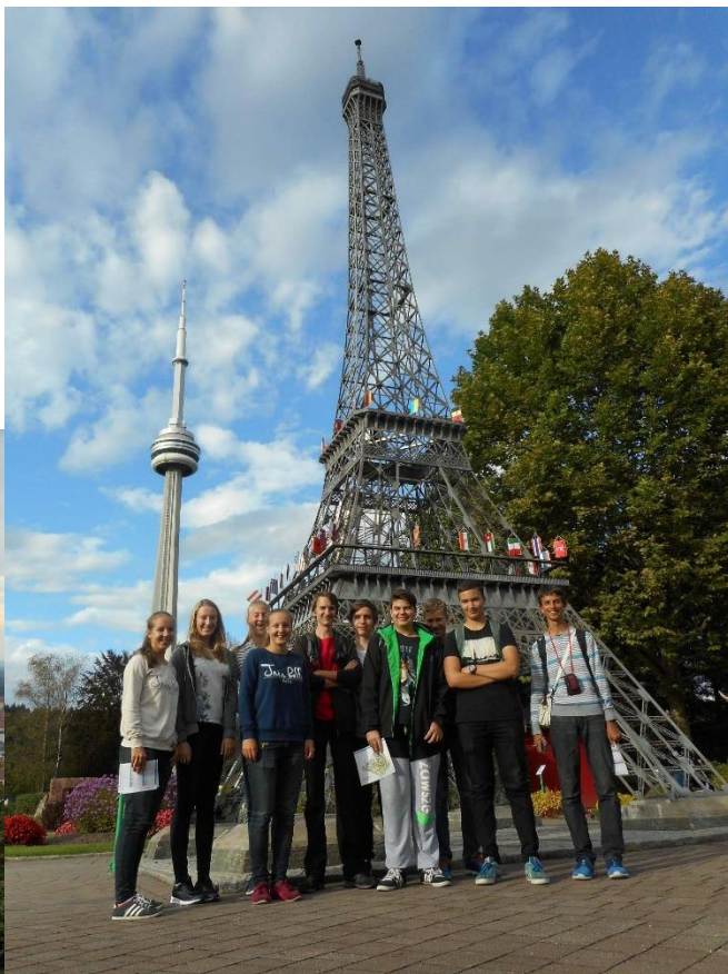
Pod Eifelovou věží v Minimundusu v Klagenfurtu