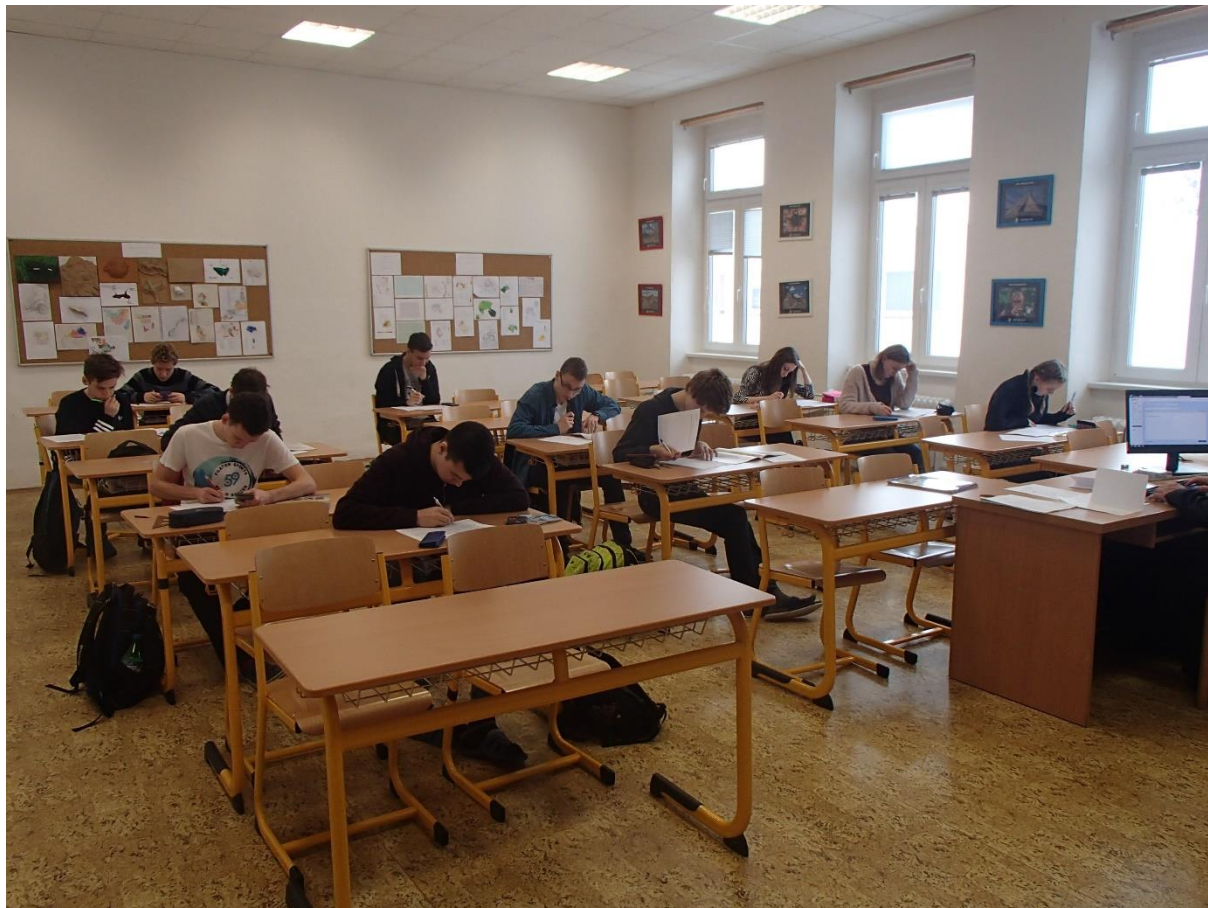
Školní kolo ZO - kategorie D

Blahopřejeme vítězům letošního ročníku a přejeme jim hodně štěstí v okresním kole soutěže.