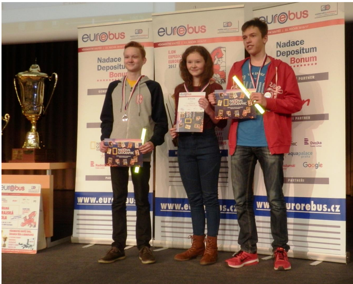
2. místo v kraji v kategorii ZŠ 02 - pro družstvo třídy 2.C