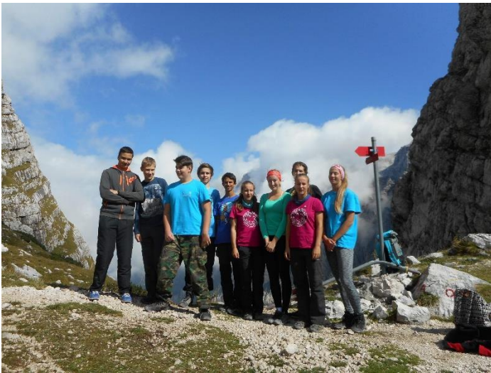
Po výstupu v sedle Zadnja Ljuka ( 1800m.n.m.)