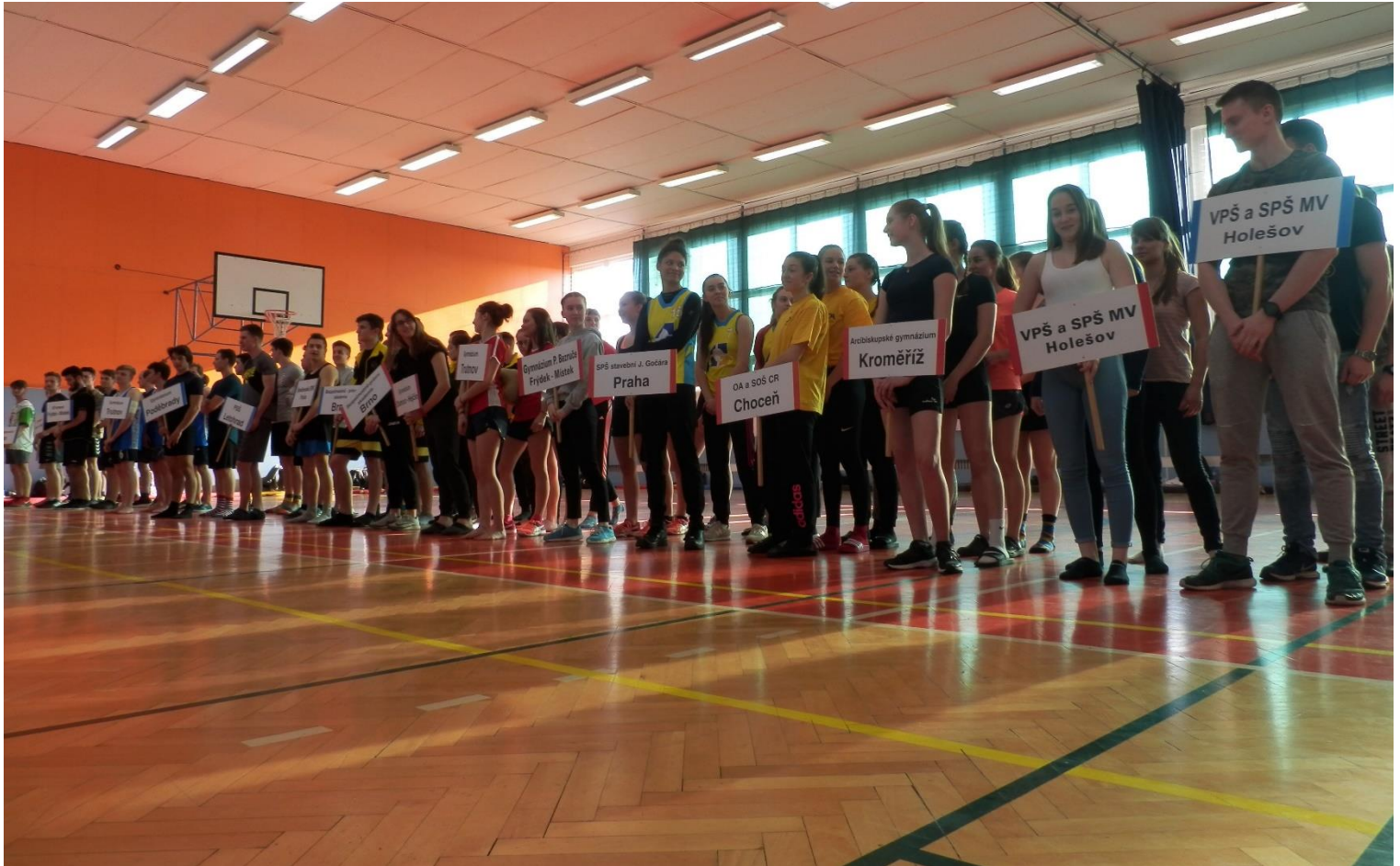
slavnostní zahájení a nástup

Ve čtvrtek 21. 3. a v pátek 22. 3. 2019 se na Vyšší a Střední policejní škole MV v Holešově konalo republikové finále ve šplhu. Pro marodku chlapců, bohužel, letošní ročník jen s družstvem děvčat.