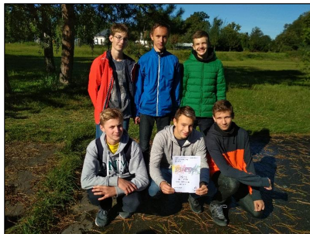
Fotky družstev z okrskového kola ve FM.