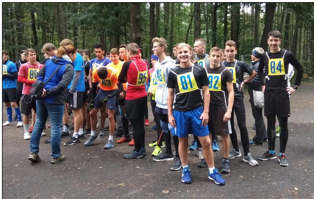
Fotky z okresního kola v Třinci.