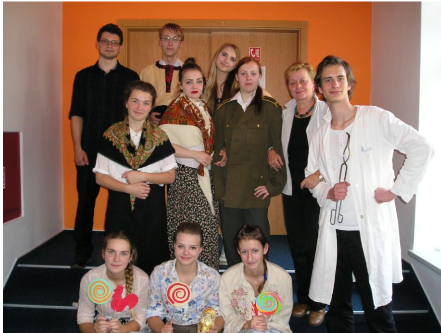
Studenti 4. B, Gymnázium Petra Bezruče, Frýdek-Místek