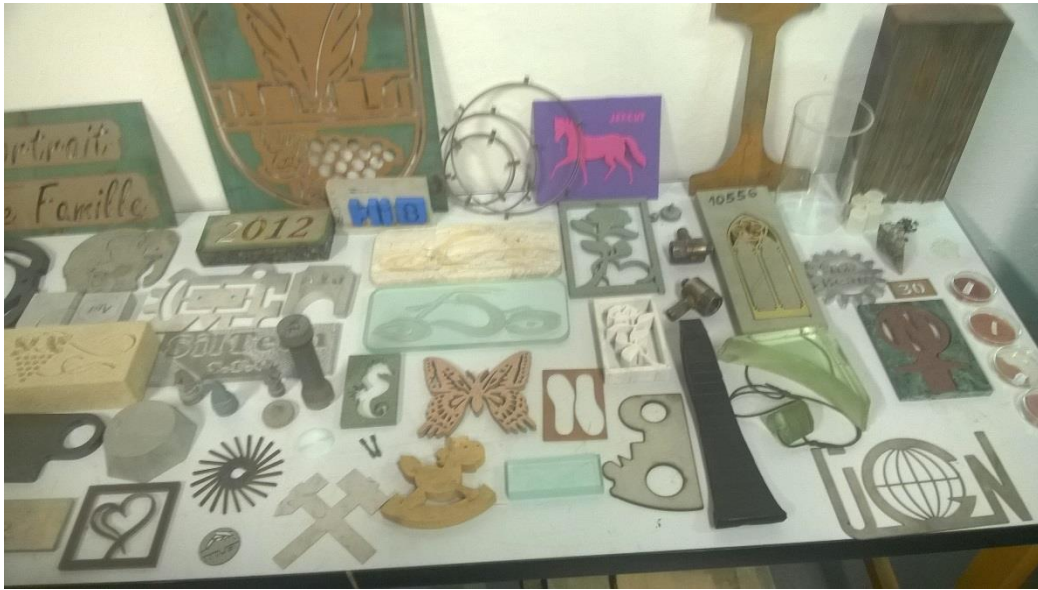
Fotky z vědecko-technického jarmarku: