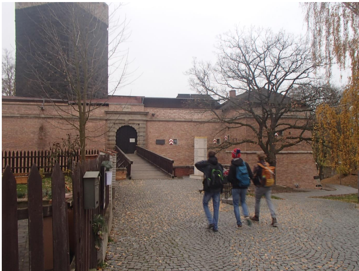
Před chebským románským hradem – falcí

Čekala nás dlouhá cesta vlakem napříč republikou. V Chebu – „vstupní bráně do Čech“ jsme se vydali se prohlídku historického jádra města. Po obhlídce Špalíčku následoval starý románský chebský hrad – falc. Do pevnosti jsme bohužel nevstoupili – byla v tuto roční dobu již zavřená a stejně tak muzeum sídlící v domě, kde byl roku 1634 zavražděn vévoda frýdlantský Albrecht z Valdštejna. Místo toho jsme objevili Retromuseum, které bylo opravdu výborné a přeneslo nás do světa předmětů všedního dne 50. – 80. let 20. století.