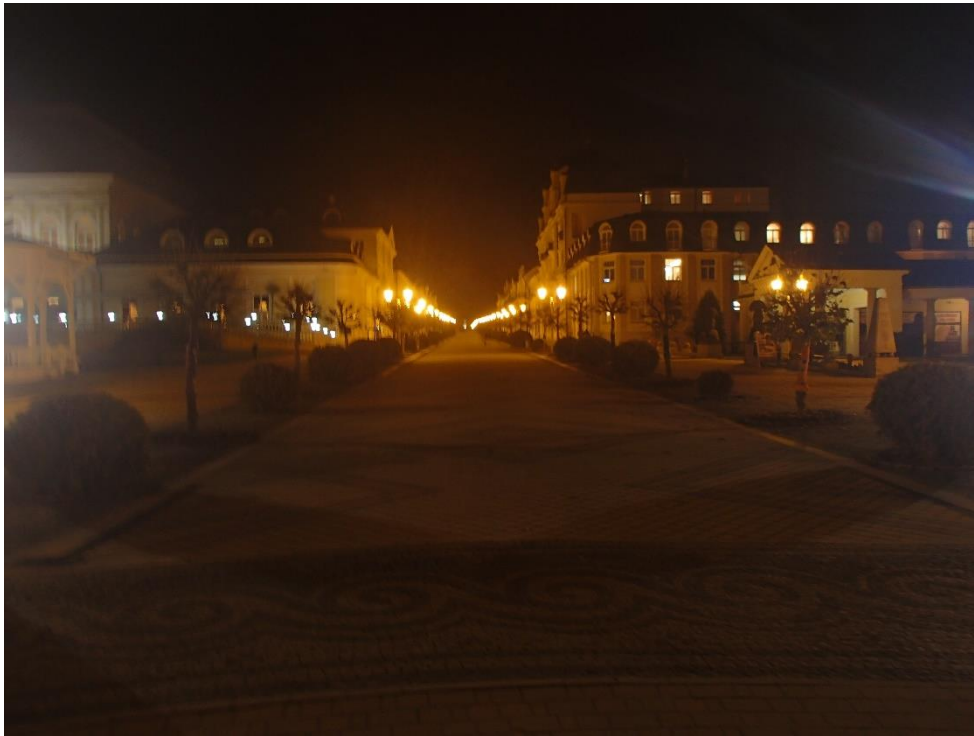
Večerní Františkovy Lázně

i u císaře Josefa II. a procházeli kolem čistého nádherně osvětleného klasicismu všeho druhu. Architektonický zážitek umocňovala klidná večerní atmosféra lázeňského města.